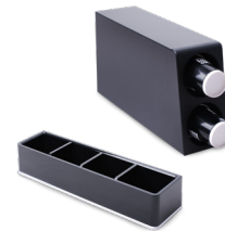
Kopphylla och Tillbehörshylla finns som tillbehör