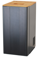
Underskåp som tillval