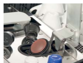
Sistema para Cápsula: Grupo cápsula auto-impulsor