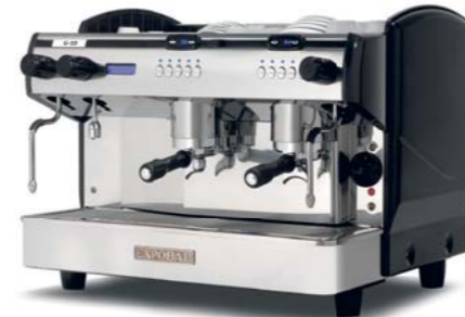
Display Control 2 GR, 3 Calderas