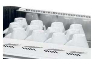
Bandeja posatazas de gran capacidad