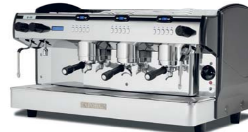
Display Control 3 GR, 4 Calderas