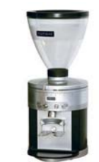
Molino Expobar 30 Grind on Demand