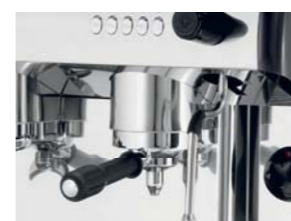
Sistema para cápsula: adaptación del grupo a cápsula