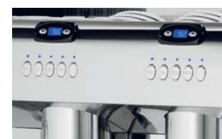
Caldera independiente de 1.5 litros