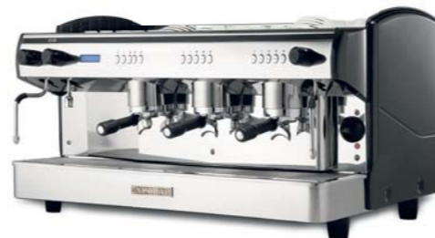
Display Control 3 GR