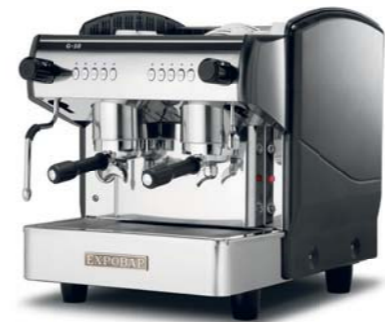
Mini Control 2 GR