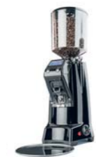
Expobar Zenith on demand