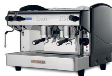
Display Control 2 GR