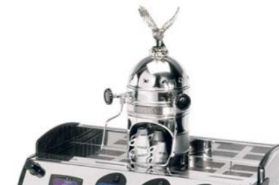
Cúpula decorativa inox