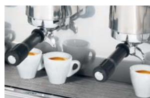
Componentes de la más alta calidad