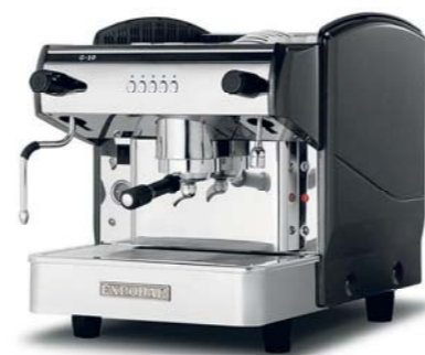
Mini Control I GR